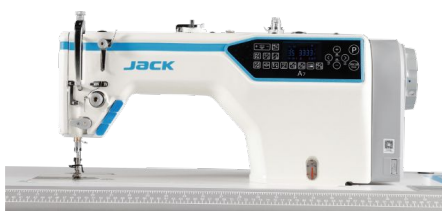
Jack A7-D – швейна машина з цифровою системою просування матеріалу