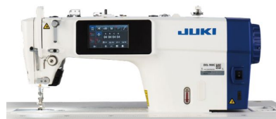
Juki DDL900C – швейна машина з системою контролю довжини стібка