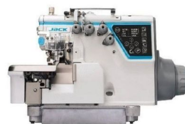
Jack C6 – оверлок з розпізнаванням товщини матеріалу