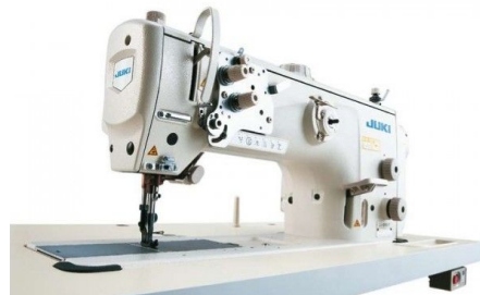
Juki LU-2810AS – машина човникового стібка з унісонною подачею