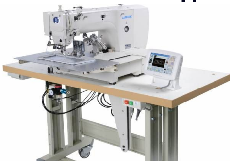
Jack JK-T2210D/F1 – машина з програмованим циклом шиття