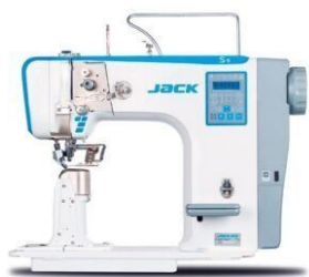
Jack S5-91 – колонкова машина з роликівим просуванням матеріалу